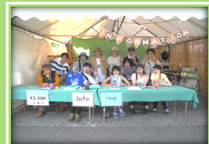
インフォメーション