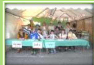
インフォメーション