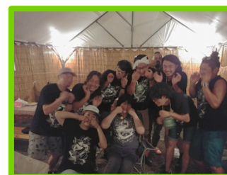
オフィス/制作スタッフ