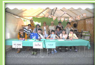
インフォメーション