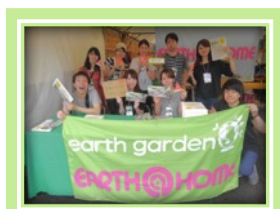
インフォメーション