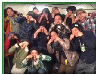
オフィス/制作スタッフ