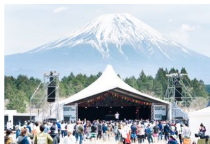
GO OUT JAMBOREE / CAMP