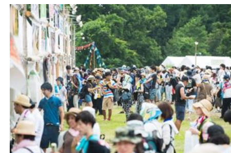
ap bank fes

earth gardenでは、主催フェスの他に、野外フェス・イベントの制作オフィスとして、全国様々なイベントに関わっています。