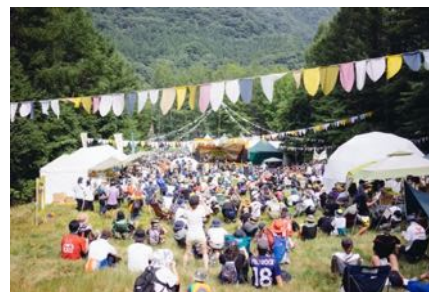
FUJI ROCK FESTIVAL